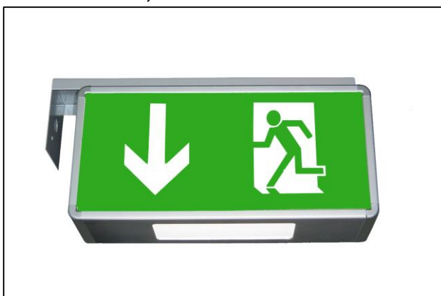
Console mural, latéral: D + CALS