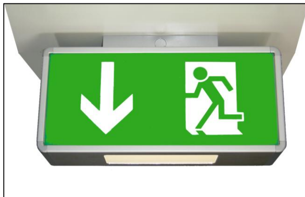
Montage sous plafond: D